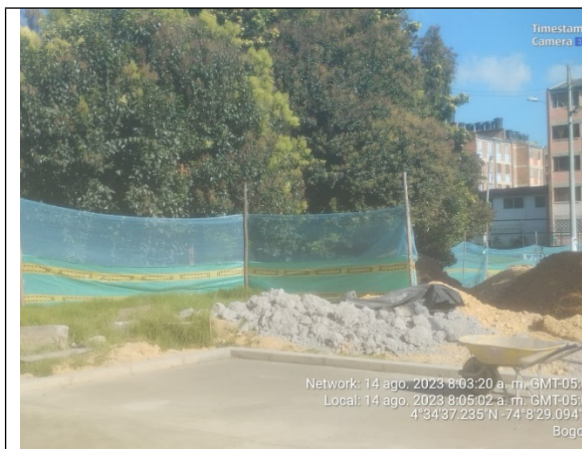
Fotografía No. 11. RCD sin cubrimiento ni aislamiento de zonas verdes.