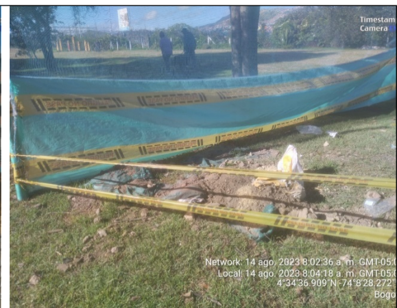
Fotografía No. 12. RCD sin cubrimiento ni aislamiento de zonas verdes.

Como resultado de la visita técnica a la estructura ecológica principal – EEP de la RDH Complejo de Humedales el Tunjo y río Tunjuelo del día 14 de agosto de 2023, se evidenciaron situaciones ambientales en el predio identificado mediante coordenadas geográficas -74.14167, 4.57765, sector catastral 002413001005 y CHIP catastral AAA0017BWPA, propiedad de la CAJA PROMOTORA DE VIVIENDA MILITAR Y D; presuntamente llevadas a cabo por el INSTITUTO DISTRITAL DE RECREACION Y PEORTE – IDRD, por consiguiente, dentro proceso de control efectuado se levantaron los puntos intervenidos con el apoyo de comisión topográfica de la Subdirección del Recurso Hídrico y del Suelo – SRHS, mediante la utilización de equipo topográfico ESTACIÓN TOTAL ES105 - BS1627, identificando las afectaciones ambientales que a continuación, se describen: